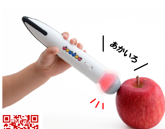
「みつけてみよう！いろキャッチペン」

株式会社タカラトミー(代表取締役社長:H.G.メイ/所在地:東京都葛飾区)は、あそびを通して子どもの成長を育む“遊育(ゆういく)”トイシリーズ”JOUJOU(ジョジョ)”の最新作として、リアルサウンドへんしんバンド「へんしんしよう！おとぼんど」2種、色を読み取るデジタルお絵かきペン「みつけてみよう！いろキャッチペン」2種(希望小売価格各3,800円/税抜き)を、2015年9月10日(木)から、全国の玩具専門店、百貨店・量販店の玩具売場、インターネットショップ、タカラトミー公式ショッピングサイト「タカラトミーモール」 http://takaratomy.jp/shop/ 等にて発売いたします。