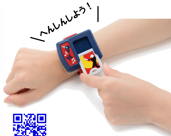
「へんしんしよう！おとぼんど」