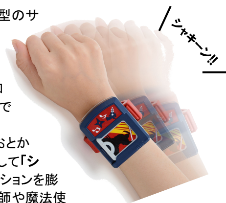
動きに合わせて音が鳴ります

この技術により、身近なもの(おもちゃの剣など)を持って本体にサムライの「おとかぎ」をセットすれば、「拙者侍、いざ参ろう！」と音声ナビがなり、腕の動きに連動して「シャキーン！」「ズバッ！」と音がします。まるで侍に変身したかのようにイメージションを膨らませて遊ぶことができます。忍者やサムライなどの「カッコいいわざ編」と漫才師や魔法使いなどの「あこがれのおしごと編」の2種類展開いたします。