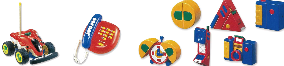
1989年より展開していた当時のJOUJOUシリーズ

1 「JOUJOU(ジョジョ)」とは、今も昔も変わらない子どものあそびにその時代の最新テクノロジーを取り入れて、今までに体験したことのない驚きや発見を提供し、これからのライフスタイルとともに進化する親子で一緒に楽しめるプリスクールトイを提案していきます。 (JOUJOU はフランス語の「おもちゃ」=jouet(ジョ)の子どもの言い方)